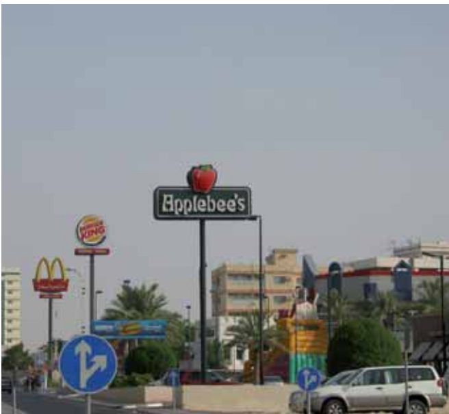
Fast food restaurants op een rij: Amerikaanse droom of nachtmerrie?

Terwijl de jeugdige burger op school wordt opgevoed om gezond te leven, ondergaat de volwassen burger die behandeling op de werkplek. Voortvloeiend uit het Convenant Overgewicht hebben VNO-NCW en FNV afgesproken het overge-