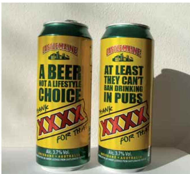
Dappere bierbrouwer in Australië doet aan politiek incorrecte burgerlijke ongehoorzaamheid.

Als bewijs voor de verslechterde gezondheid wijst de regering op ons relatief achterblijven in de stijgende levensverwachting in de landen van de OESO sinds 1960. Was de levensverwachting van de Nederlander in 1960 de op een na hoogste, nu zijn we afgezakt naar de status van middenmoter. Deze relatieve achteruitgang is echter feitelijk een grote vooruitgang. Vrouwen “leven sinds 1950 gemiddeld 8,3 jaar