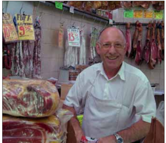
Opgewekte slager in Barcelona lijdt nog niet onder westers onbehagen over leven in overvloed

De bezorgdheid over ons klimaat en die over ons voedsel en voedingspatroon zijn eveneens kenmerkend voor de voorzorgcultuur. Elders in dit nummer komt dat in algemene zin aan bod. Hier wijs ik er vooral op dat voorzorgbeleid gericht is op onzekere dreigingen op de lange termijn. Naarmate de gevreesde gevaren zich verder weg in de toekomst bevinden, is de kennis onzekerder waarop we hier en nu ons beleid baseren. En naarmate de kennis onzekerder is, is er meer ruim-