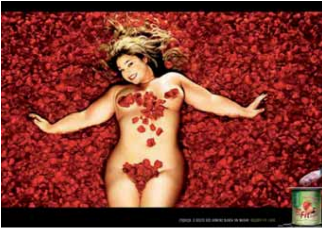
Mooi dik is niet lelijk.

Maar de eenzijdige beleidszorgen over overgewicht kunnen minstens als onevenwichtig worden aangemerkt. Met de nadruk op gewichtsverlies onderstreept het beleid dit schoonheidsideaal. Naast de sociale sancties die dikke mensen moeten verdragen, krijgen ze nu ook officiële ‘voorlichting’ die als verwijt begrepen kan en soms ook moet worden. De bezorgdheid van de ethici over de stigmatiserende werking van het beleid en de interventies van professionals is daarom terecht. Het lijkt in dat beleid niet zozeer te gaan om duidelijke risico’s voor de volksgezondheid als wel om moraalpolitiek die gevoed wordt door dominante culturele overtuigingen. Natuurlijk zijn er wel gezondheidsproblemen verbonden met gewicht, maar die zijn alleen goed aanwijsbaar bij extreme magere of zwaarte. Hier gaat het om daadwerkelijk zieke mensen die concrete zorg nodig hebben.