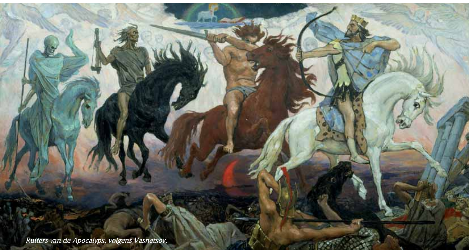
Ruiters van de Apocalyps, volgens Vasnetsov.